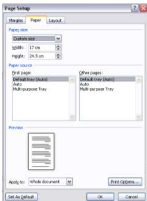
شکل ۲- تنظیم اندازه صفحه